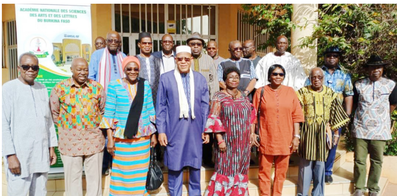
Photo de famille des participants à l'Assemblée générale ordinaire du 19 décembre 2024.