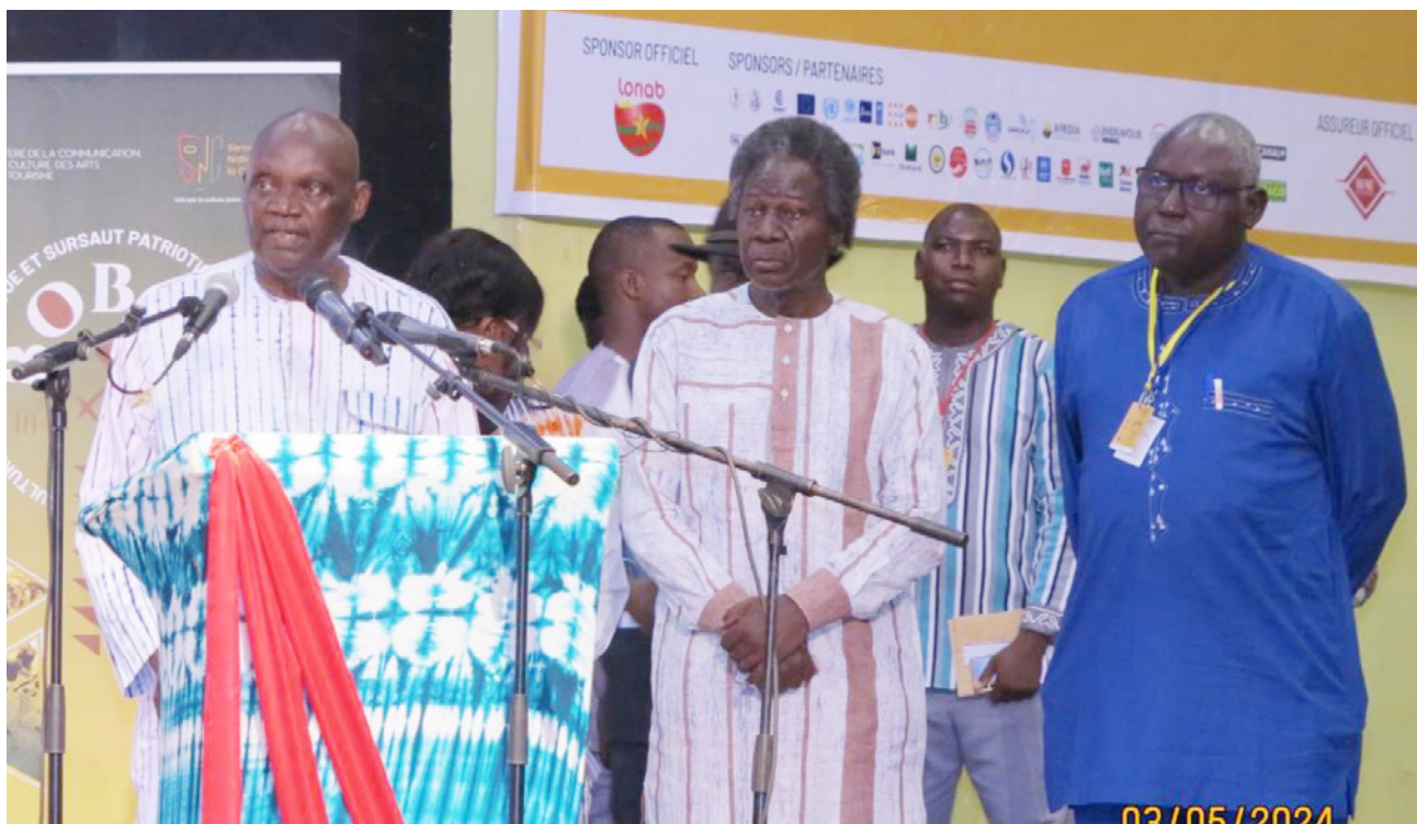
Les membres de l'ANSAL-BF à la cérémonie de proclamation et de remise des prix spéciaux de la 21ème édition de la SNC

L'ANSAL-BF a accompagné la SNC en octroyant deux Prix spéciaux ANSAL-BF (un prix en peinture et un prix en sculpture sur bronze) dans la catégorie B arts plastiques du Grand Prix National des Arts et des Lettres. Les œuvres primées mettent en évidence la vocation de l'ANSAL-BF à savoir « contribuer à promouvoir le développement socio-économique du Burkina Faso par les sciences, les lettres, les arts et la culture », et magnifient les idéaux de l'Institution. Chaque œuvre retenue a reçu un prix d'un montant de cinq cent mille (500 000) Francs CFA, une attestation et une prime compensatrice de trois cent mille (300 000) francs CFA versée à l'artiste au titre de l'acquisition de son œuvre par l'ANSAL-BF qui en devient le propriétaire. Ces œuvres constituent donc une collection de l'ANSAL-BF.