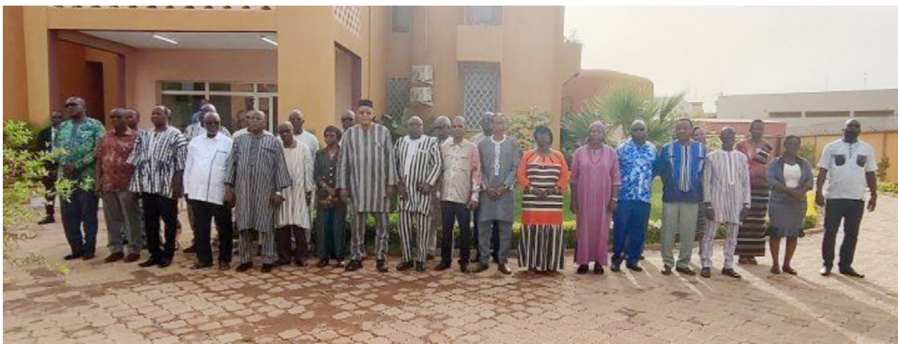
Les académiciens et le personnel administratif à la montée des couleurs.