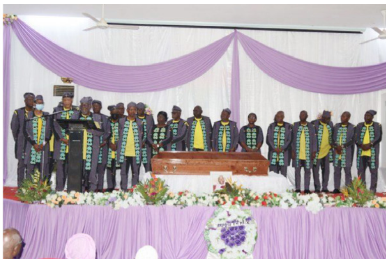
La délégation de L'ANSAL-BF à la cérémonie d'hommage.