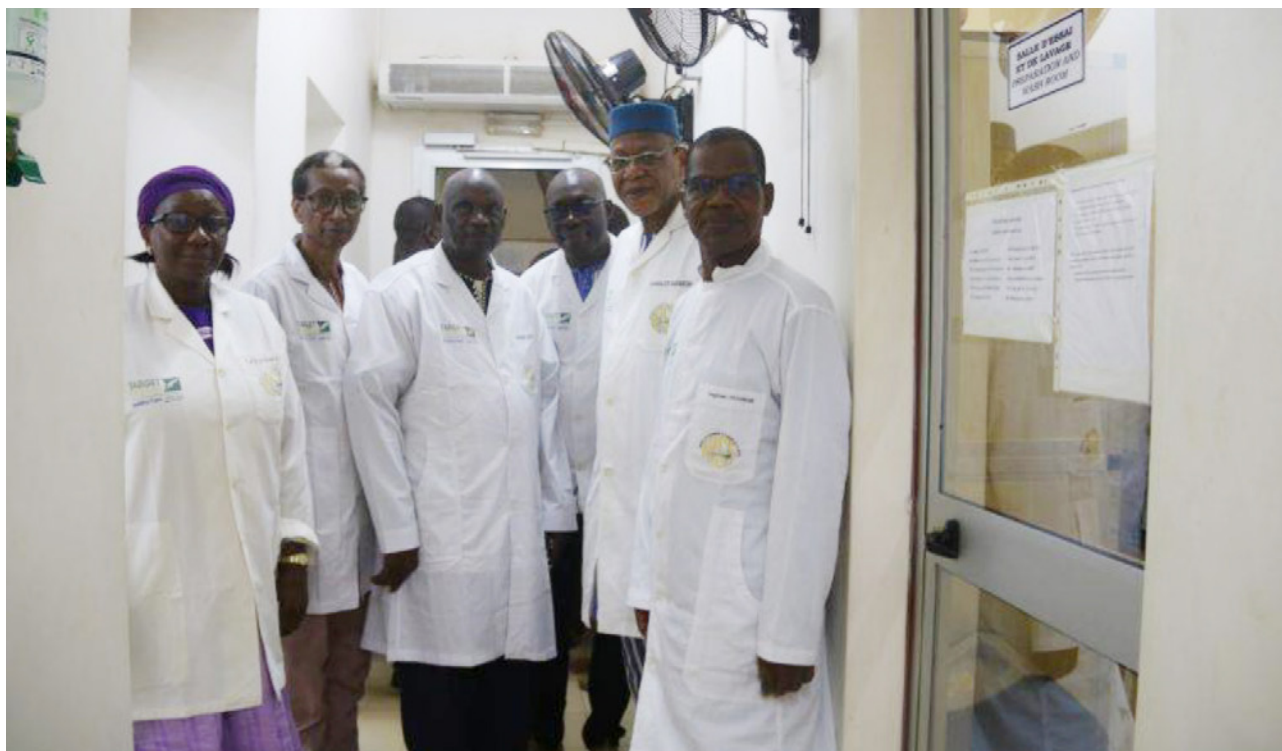
La délégation de l'Académie dans l'insectarium du projet Target Malaria