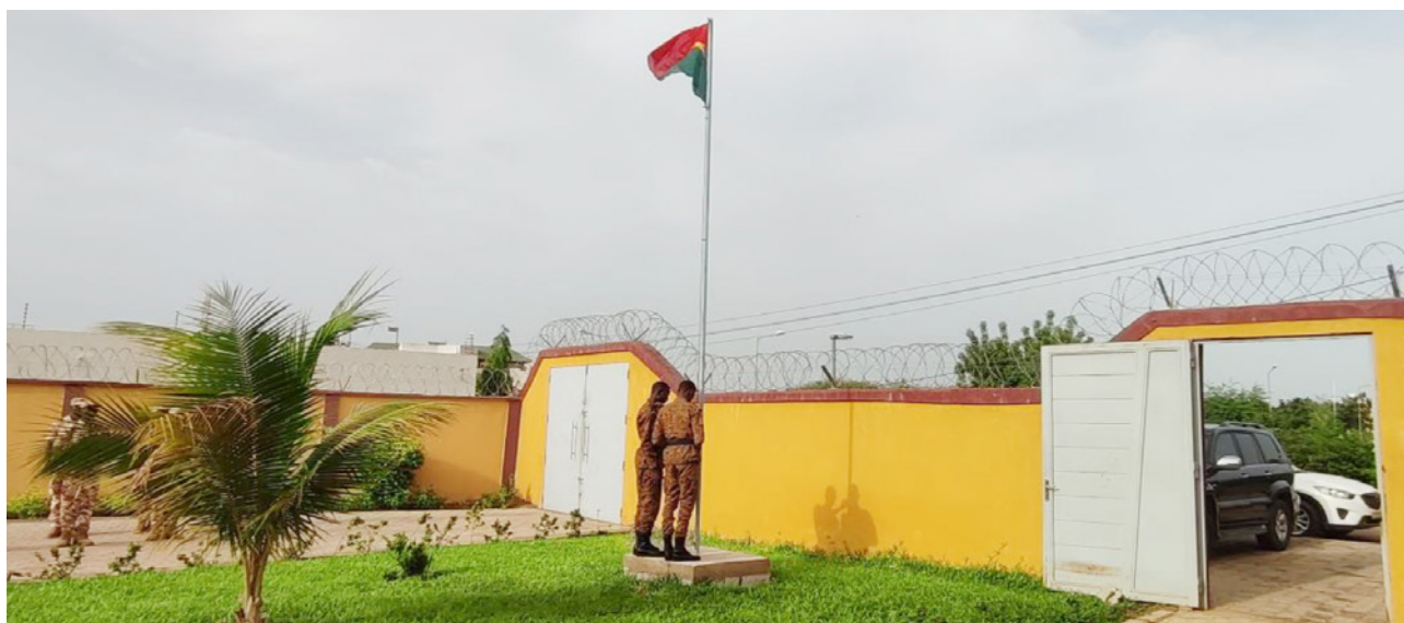
Montée des couleurs à l'ANSAL-BF.

Le président de l'ANSAL-BF a salué la forte mobilisation des Académiciens, preuve de leur attachement aux valeurs patriotiques, déjà illustrée en 2023 par leur contribution financière volontaire de trois millions (3 000 000) de francs CFA en soutien au Fonds de soutien patriotique.