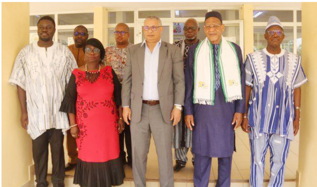
La délégation de l'ANSAL-BF reçue par le Secrétaire exécutif du CILSS.

En 2024, dans le cadre des activités de la Commission des Relations avec les Partenaires (CRP) de l'ANSAL-BF, plusieurs actions ont été engagées pour opérationnaliser la stratégie de mobilisation des ressources financières adoptée en 2023. Ces initiatives ont ciblé des partenaires tels que le Comité Permanent Inter-États de Lutte contre la Sécheresse dans le Sahel (CILSS), l'Union Internationale pour la Conservation de la Nature (UICN) et l'Ambassade royale des Pays-Bas.