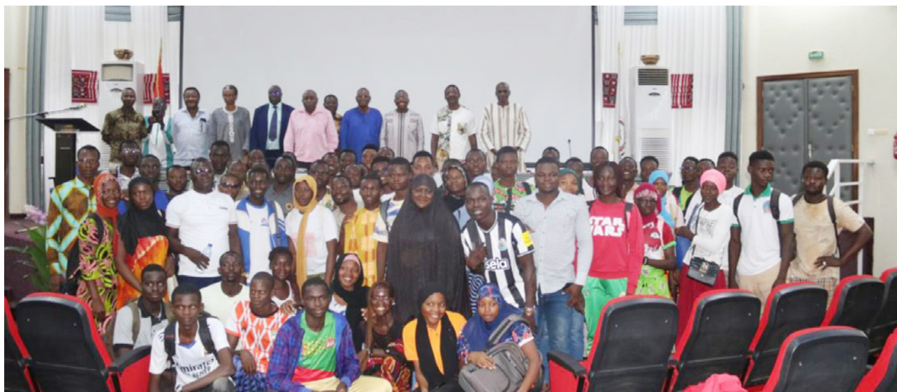
Photo de famille des participants de la conférence sur les sciences spatiales à l'Université Joseph Ki-Zerbo.