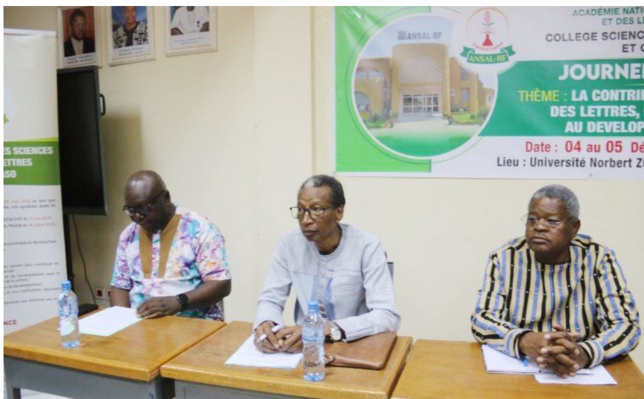
Présidium des premières journées scientifiques sur le thème « La contribution des sciences humaines, des lettres, des arts et de la culture dans le développement du Burkina Faso » à l'Université Norbert Zongo (UNZ) à Koudougou.

Tenue des premières journées scientifiques sur le thème « La contribution des sciences humaines, des lettres, des arts et de la culture dans le développement du Burkina Faso », organisées du 4 au 5 décembre 2024, à l'Université Norbert Zongo (UNZ) à Koudougou. Ces journées scientifiques étaient inscrites dans l'objectif de mobiliser tous les savoirs afin de promouvoir le développement socio-économique du Burkina Faso à travers la production, l'exploitation et la valorisation des résultats de la recherche. Les communications présentées relevaient de divers domaines de recherche : traduction, linguistique, histoire, philosophie, sciences du langage, archéologie, genre et développement, sciences de l'information et de la communication et sciences politiques, économiques et religieuses. Les réflexions ont été organisées en deux panels avec au total onze (11) communications.