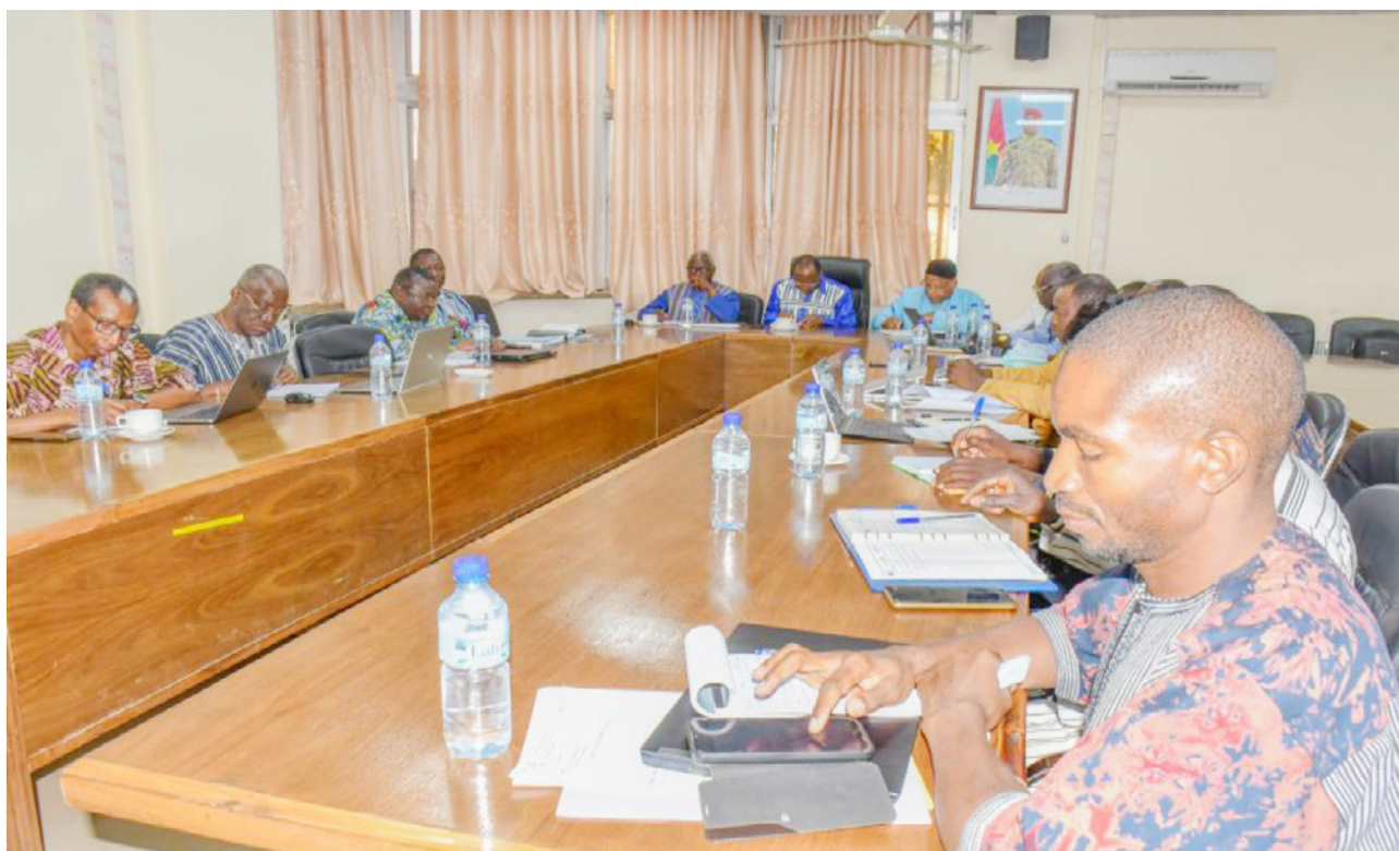
Session d'information avec le ministre en charge de l'enseignement supérieur et celui de la santé ainsi que des représentants des ministres du commerce, de l'agriculture et de l'environnement.

En 2025, la recherche se poursuivra avec la formulation de recommandations stratégiques pour maximiser l'impact socio-économique de la filière coton au Burkina Faso.