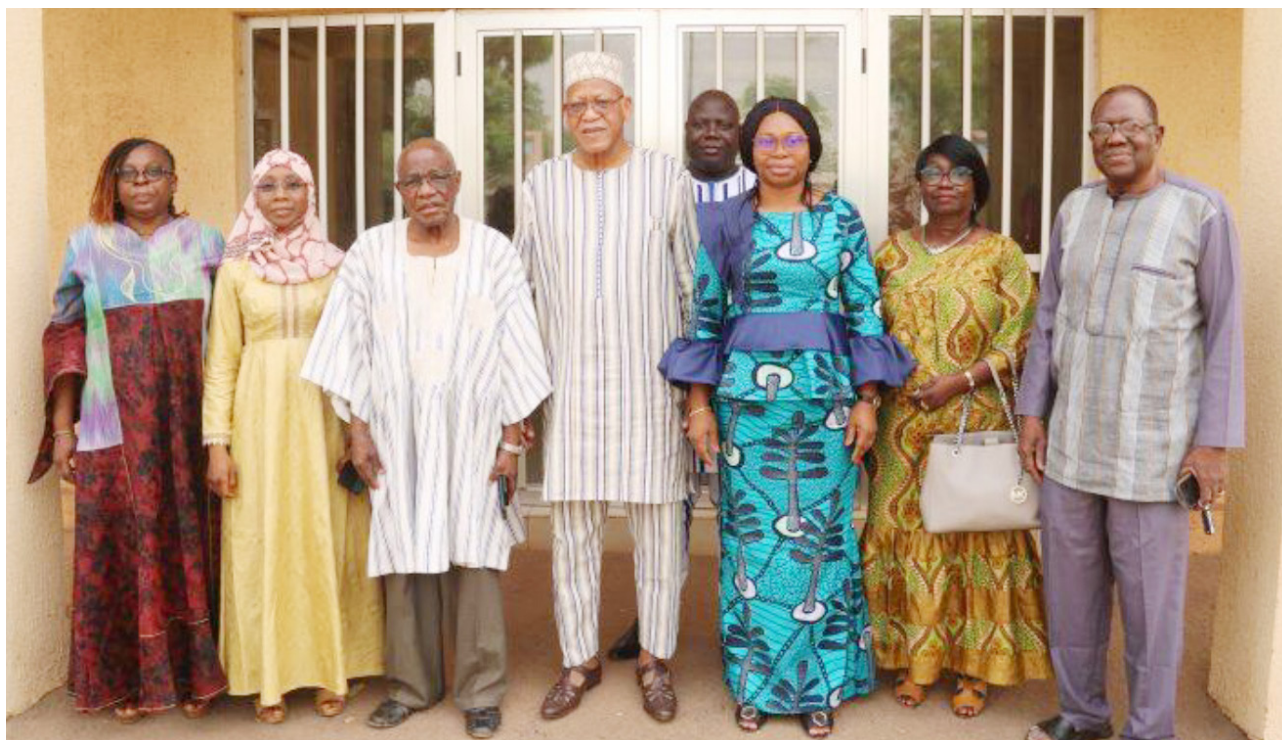
Une délégation de l'ANSAL-BF reçue par la ministre déléguée représentant le ministre en charge des finances