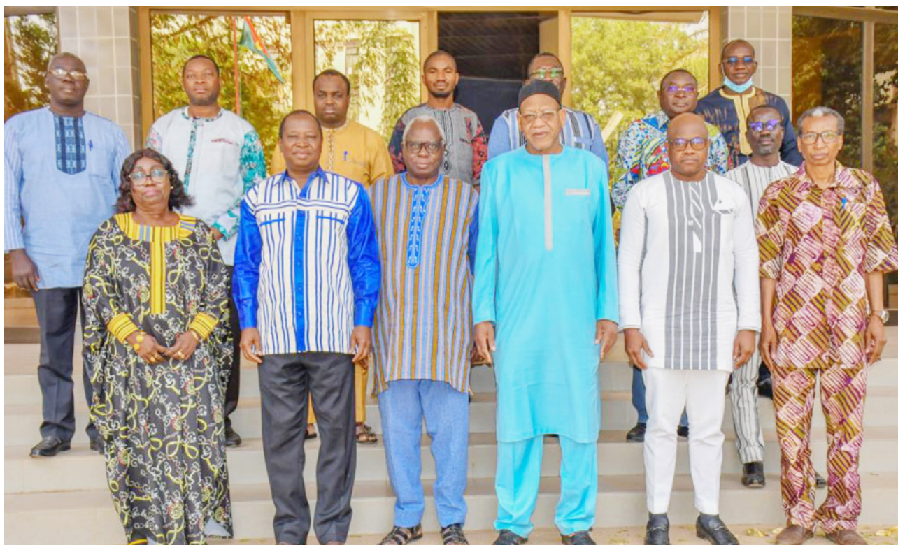
Photo de famille des participants à la session d'information.