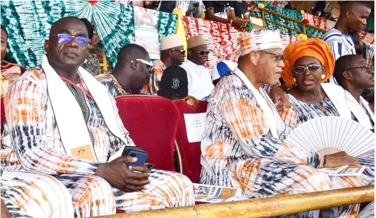
Participation de l'ANSAL-BF à la 21 ème édition de la SNC Bobo 2024