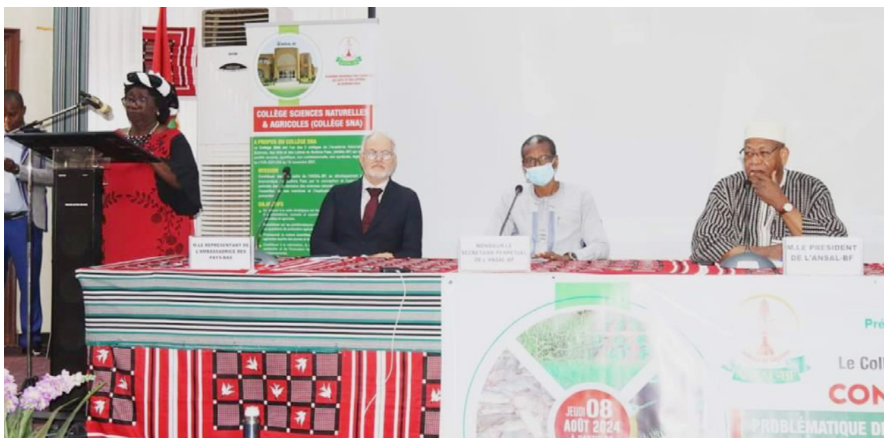
Présidium de la conférence publique sur les ressources génétiques à l'Université Joseph Ki-Zerbo.

Cette conférence a été une contribution de l'ANSAL-BF à la réalisation de sa mission de veille stratégique sur un enjeu de développement durable que représente la gestion et la protection des ressources génétiques dans notre pays. A l'issue de la conférence, les leçons tirées et les recommandations formulées ont permis de jeter des bases de futures actions.