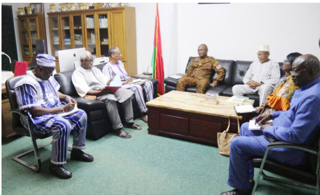
Une équipe de l'ANSAL-BF conduite par son président chez le ministre en charge de l'Agriculture