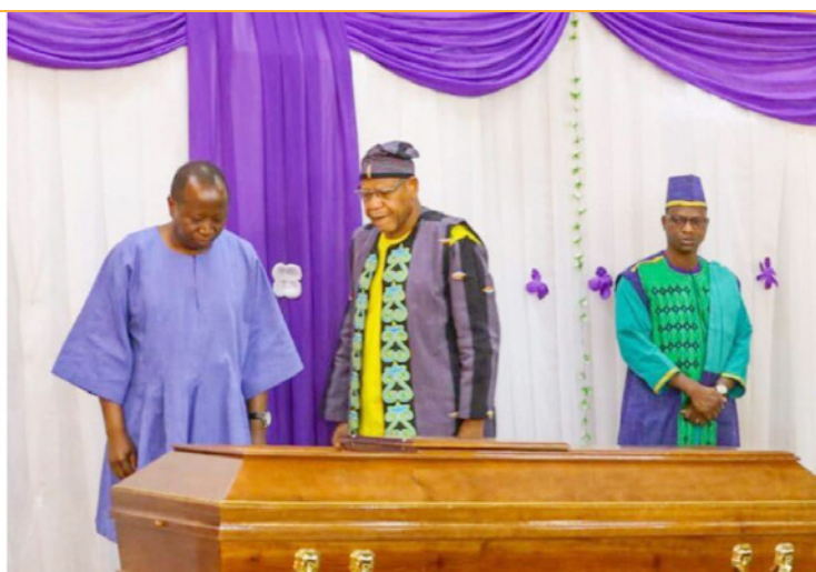
Le ministre en charge de l'enseignement supérieur et le Président de L'ANSAL-BF à la cérémonie d'hommage.