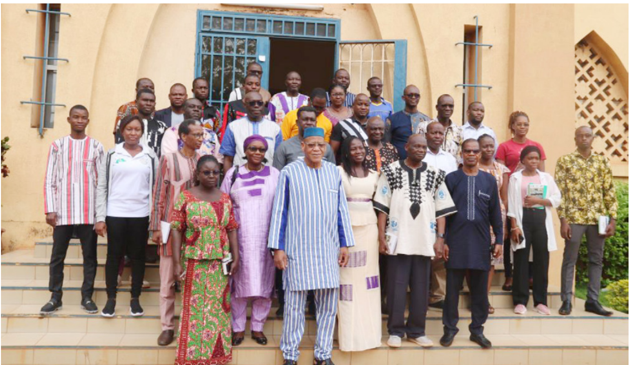
Photo de famille de la délégation de l'ANSAL-BF avec Target Malaria et les journalistes