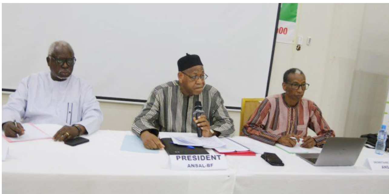
Présidium de l'atelier de validation de l'état des lieux de la filière Coton à Koudougou.