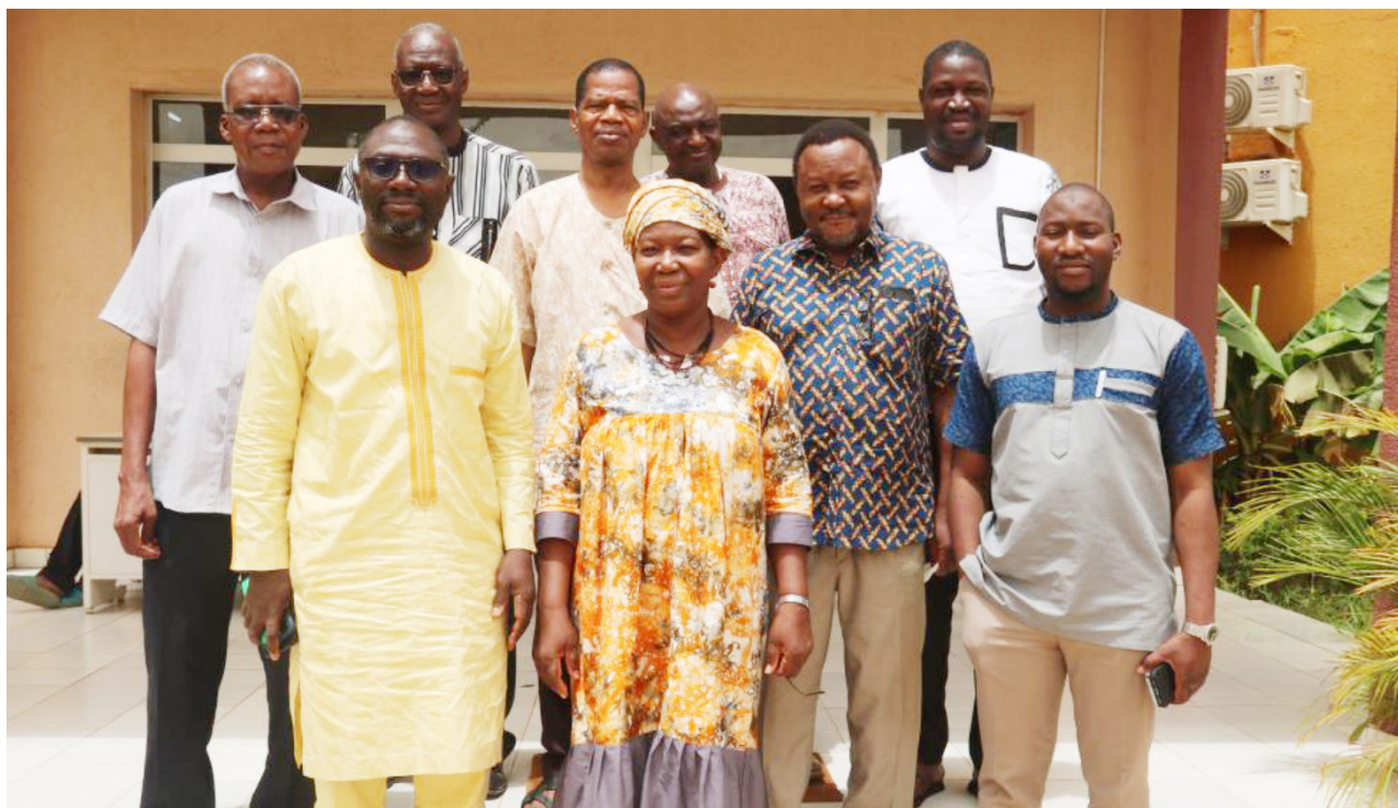
Photo de famille des participants à la séance de travail sur l'actualisation de l'étude sur l'exploitation aurifère au Burkina Faso