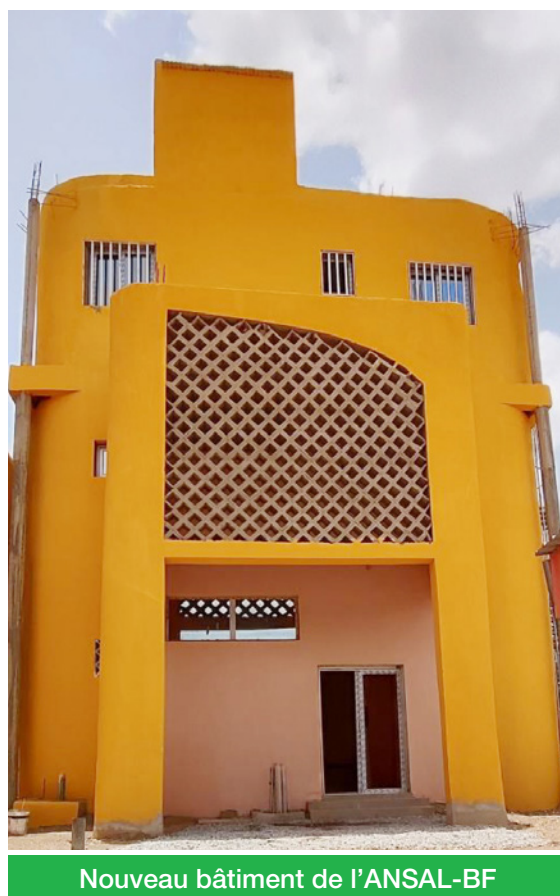
Nouveau bâtiment de l'ANSAL-BF

L'ANSAL-BF a bénéficié en 2022 d'un budget d'investissement de 55 millions de francs FCA, permettant d'achever la réhabilitation de son siège et la réalisation des fondations pour une salle de réunion et de nouveaux bureaux. La non allocation de budgets d'investissement depuis l'exercice budgétaire de 2022 a contraint l'Académie à procéder au prélèvement partiel de ses budgets de fonctionnement de 2023 et 2024 ensuite convertis en budgets d'investissement afin de financer la construction de ces infrastructures achevées en décembre 2024. D'une capacité de cent cinquante (150) places, la salle de réunion accueillera désormais les assemblées générales de l'Académie. Il ne reste plus qu'à l'équiper avec des fauteuils type cinéma (assis rabattables, deux accoudoirs), ainsi qu'avec un système de projection et de sonorisation. Les bureaux devront également être meublés. Ces acquisitions dont le coût total s'élève à quarante millions trois-cent-trente-cinq mille deux-cent-soixante-quinze (40 335 275) FCFA seront financées en partie par le budget de fonctionnement de 2025.