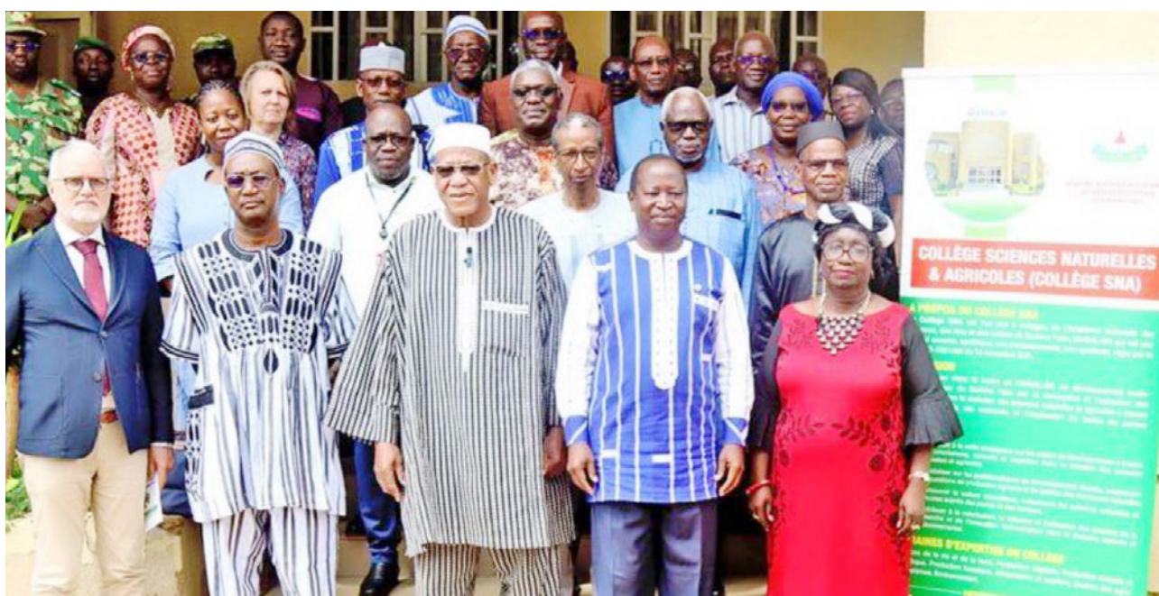
Photo de famille de la conférence publique sur les ressources génétiques à l'Université Joseph Ki-Zerbo.