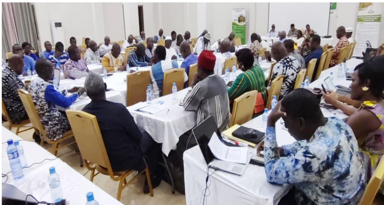
Participants à l'atelier de validation de l'état des lieux de la filière Coton à Koudougou.