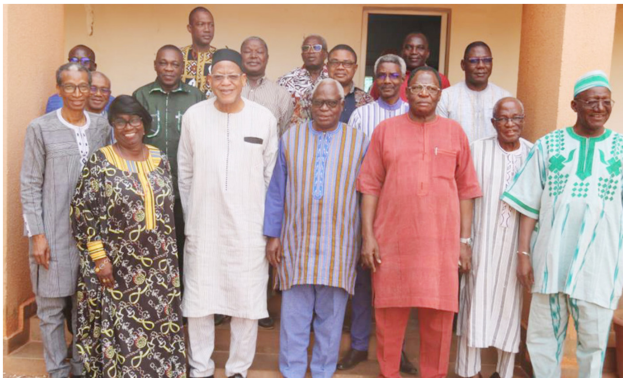
Photo de famille de la Réunion de Koudougou pour finaliser les TDR et le chronogramme de l'étude.