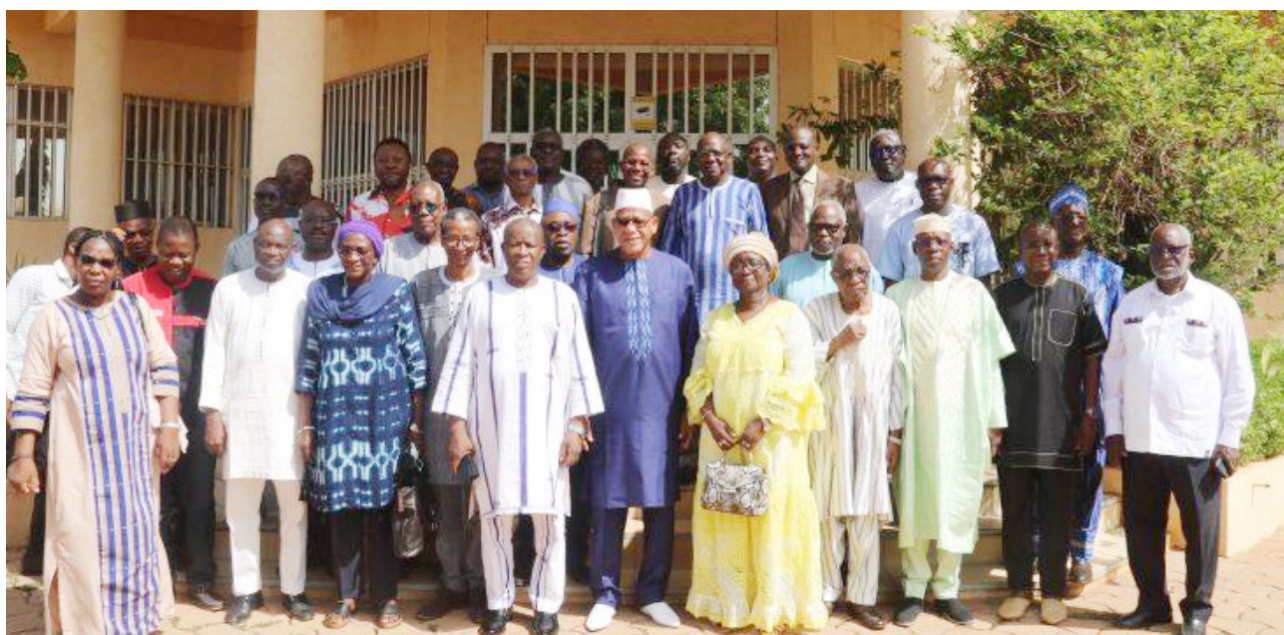
Photo de famille des participants à l'Assemblée générale ordinaire du 8 mai 2024.

L'Assemblée générale extraordinaire du 19 décembre a porté sur l'examen et la validation de l'analyse et des propositions de l'ANSAL-BF et du CAPES relative à une nouvelle organisation territoriale et administrative du Burkina Faso sur saisine du Président du Faso.