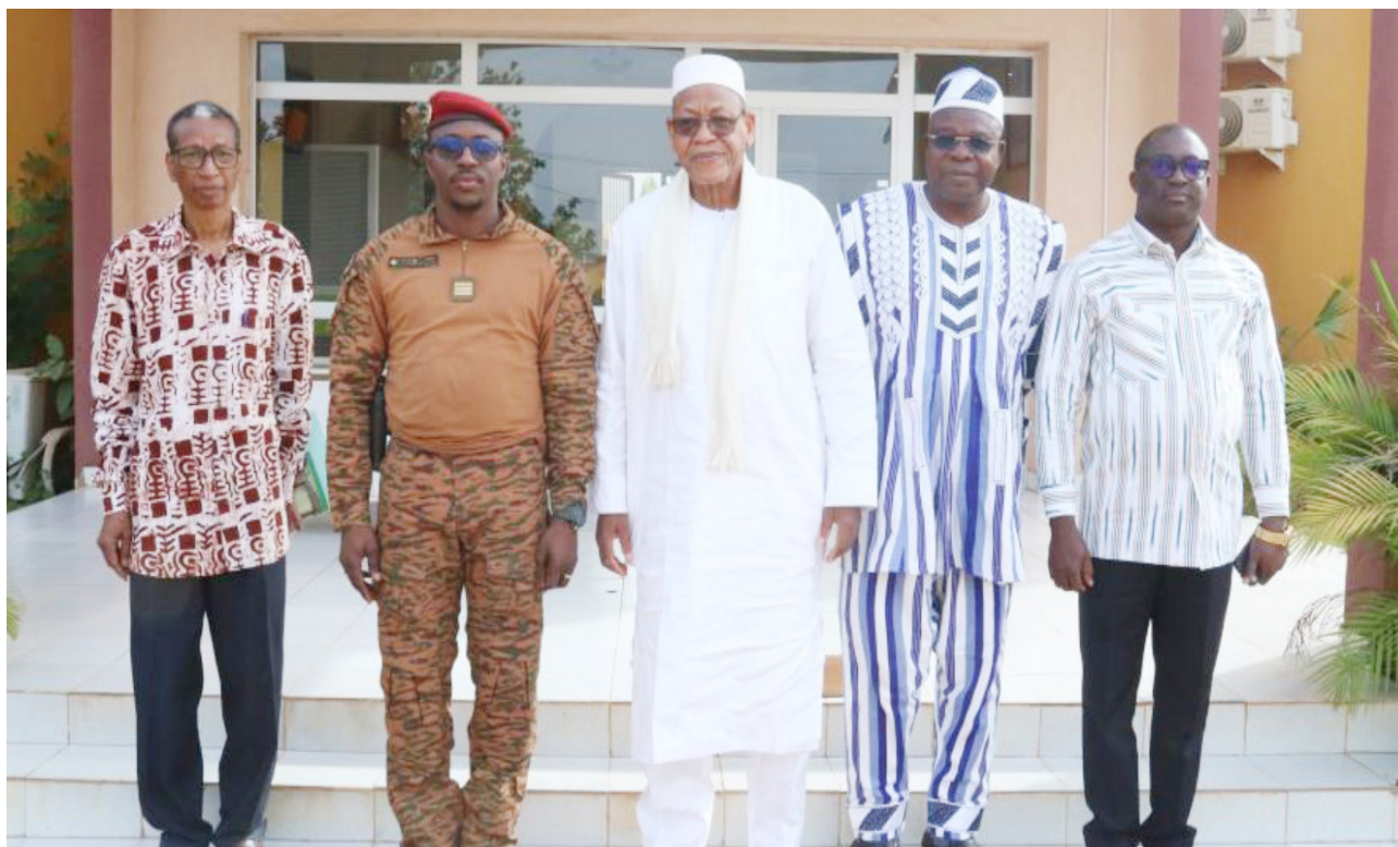
Photo de famille réunissant le Président et le SP de l'ANSAL-BF, le DE du CAPES, le Directeur de cabinet du chef de l'État ainsi que l'ex Secrétaire général du Gouvernement.