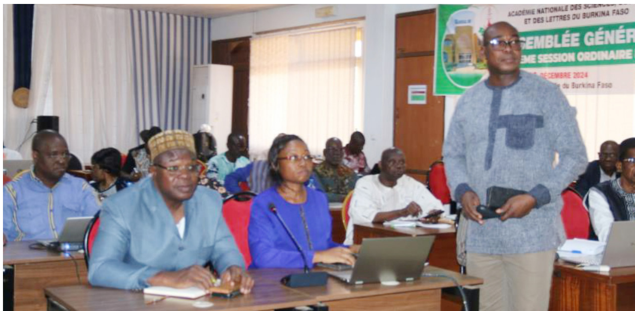
Assemblée générale extraordinaire du 19 décembre 2024.