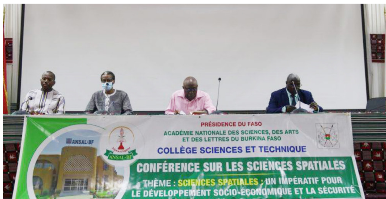
Présidium de la conférence sur les sciences spatiales à l'Université Joseph Ki-Zerbo.

Tenue d'une conférence sur les sciences spatiales qui a eu lieu le 31 juillet 2024, à l'Université Joseph Ki-Zerbo, Elle a réuni des enseignants-chercheurs, des chercheurs, des étudiants et des personnalités issues du monde socio-professionnel. Les exposés présentés dans un premier temps sur les sciences spatiales ont permis de présenter aux participants les acquis de la pratique des sciences spatiales et de faire la promotion des résultats obtenus par les chercheurs afin de susciter des vocations parmi les jeunes. Puis dans un second temps, le panel sur le thème: Sciences spatiales : un impératif pour le développement socio-économique et la sécurité a permis de cerner l'apport des sciences spatiales sur le développement en général et celui du Burkina Faso en particulier.