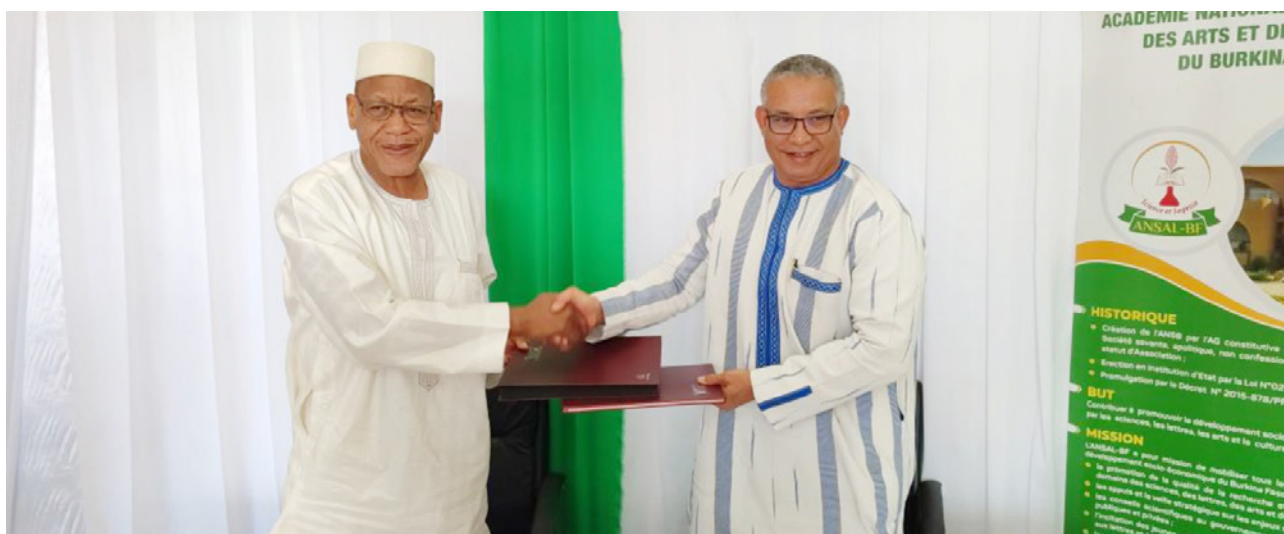
Signature d'un protocole d'accord entre le CILSS et l'ANSAL-BF.

Lors de la rencontre du 2 mai 2024 entre le CILSS et l'ANSAL-BF, en présence des premiers responsables des deux institutions, des avancées significatives ont été constatées dans leur partenariat, notamment l'organisation conjointe de colloques et conférences publiques. Cette rencontre a renforcé leur volonté commune d'établir une collaboration stratégique pour relever les défis du développement durable, de la souveraineté alimentaire et de l'innovation scientifique. Cette volonté s'est traduite par l'élaboration d'un projet de protocole d'accord, dont la signature, initialement prévue en décembre 2024, a été reportée à janvier 2025 pour des raisons d'agenda. Il est attendu de sa mise en œuvre des actions concertées mobilisant les expertises et ressources nécessaires à leur réalisation.