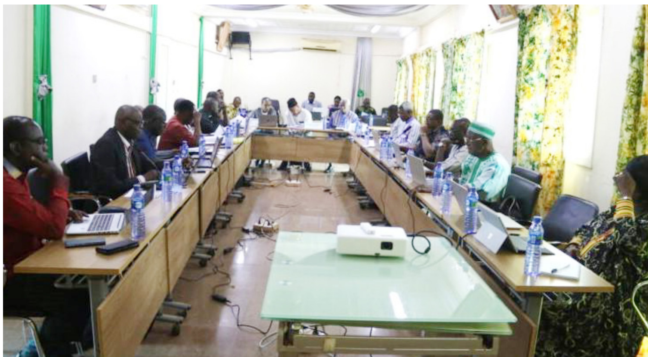
Réunion à Koudougou pour finaliser les TDR et le chronogramme de l'étude.