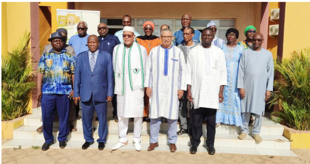
Photo de famille des deux parties.