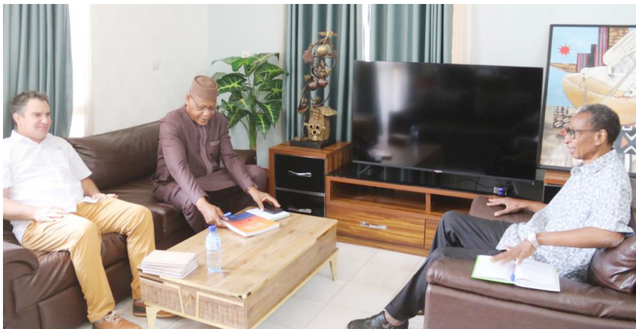
Le Représentant de l'IRD au BF reçu par le Président de l'ANSAL-BF accompagné du SP.