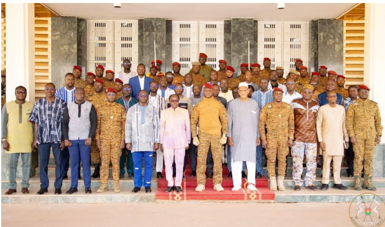
Rencontre du chef de l'Etat avec le personnel et les structures de la Présidence.

Le 8 janvier 2024, une rencontre a eu lieu entre le chef de l'Etat, le personnel et les structures de la Présidence du Faso. Dans les échanges, le chef de l'Etat a fait ressortir sa satisfaction vis-à-vis de l'ANSAL-BF, félicité publiquement l'institution pour son expertise qu'il a eu à éprouver en se référant à sa saisine pour une réflexion sur la sécurité alimentaire et nutritionnelle des personnes déplacées internes.