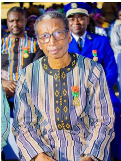
Pr Hamidou TOURE élevé au grade d'Officier de l'Ordre de l'Étalon.