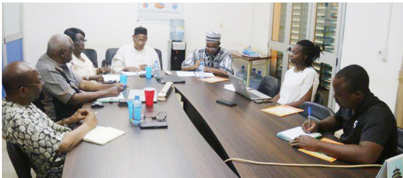
La délégation de l'ANSAL-BF reçue par le chargé de Programme de l'UICN.