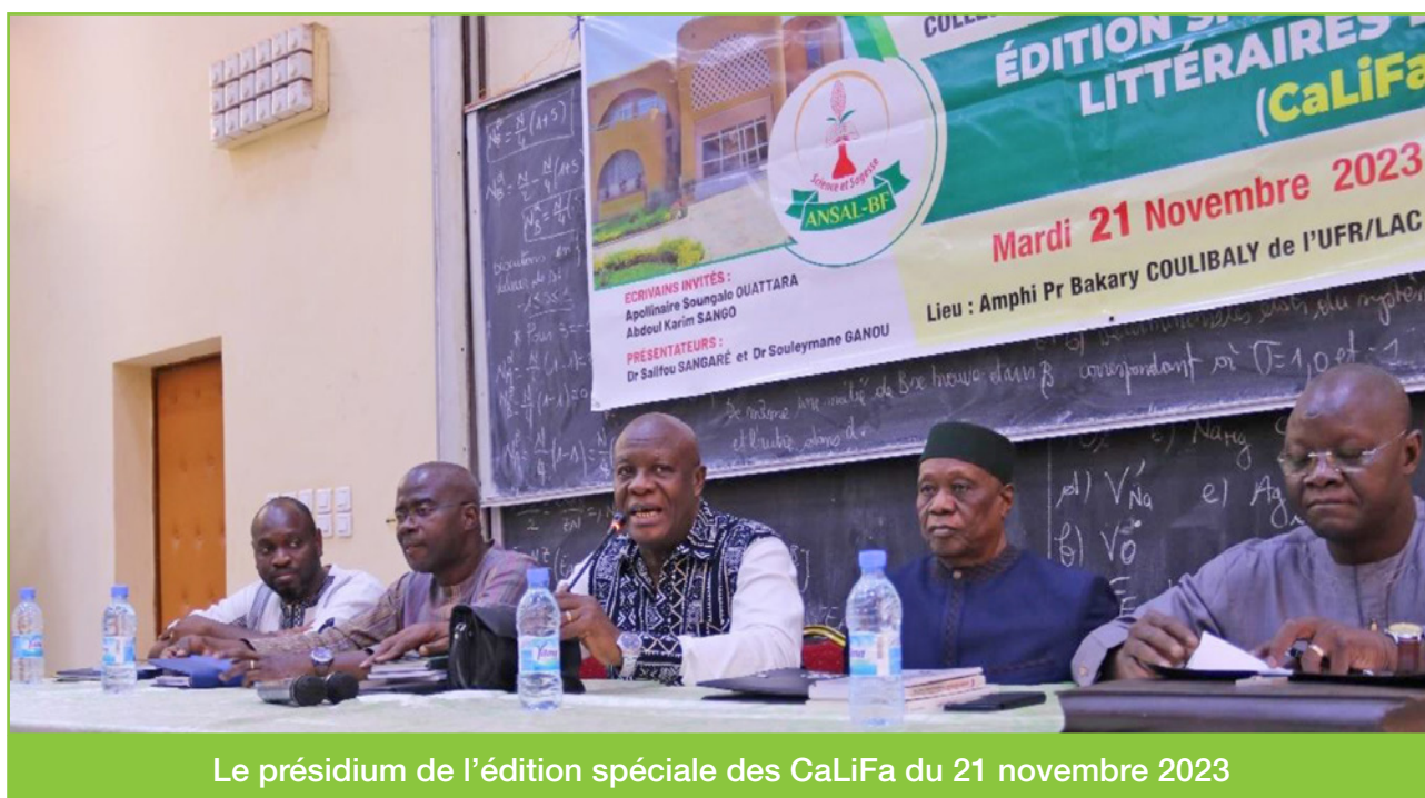
Le présidium de l'édition spéciale des CaLiFa du 21 novembre 2023

Les deux ouvrages constituent des références en tant que plaidoyers autour des questions fondamentales du Burkina Faso d'aujourd'hui : la forme de l'Etat et la place de la culture à un moment crucial de l'histoire de notre pays.