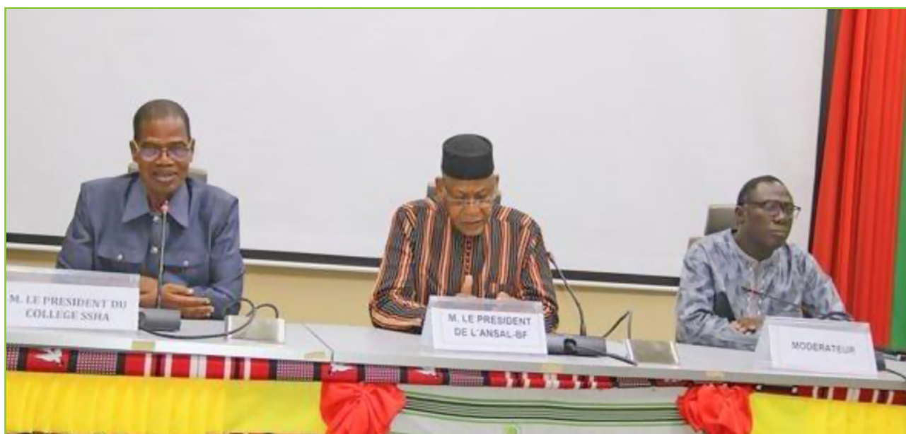
Présidium de la conférence sur l'ampleur de la drogue au Burkina Faso dans un contexte de crise