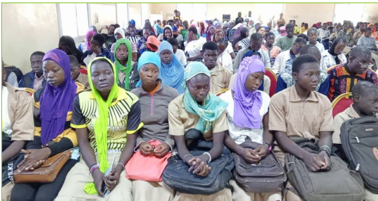
Les participants à l'édition spéciale des CaLiFa du 16 décembre 2023