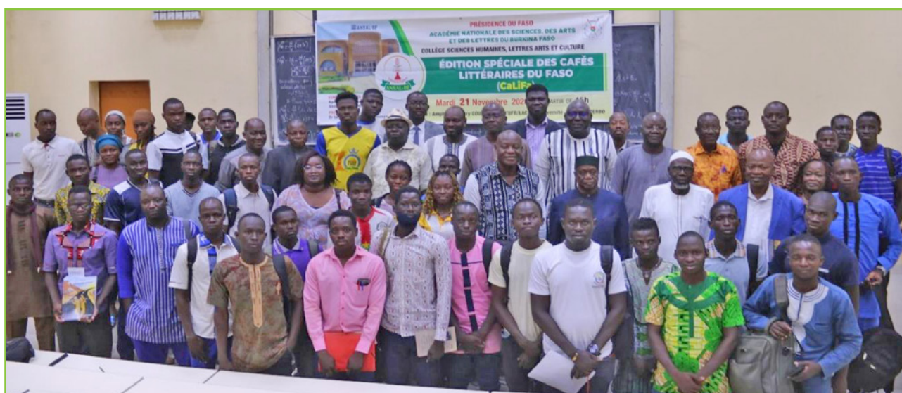
Les participants à l'édition spéciale des CaLiFa du 21 novembre 2023