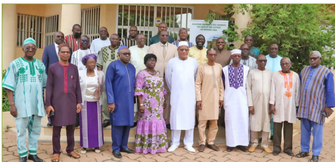
La photo de famille des participants à l'Assemblée générale ordinaire du 14 avril 2023