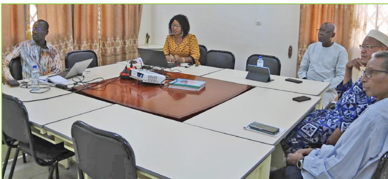
Rencontre en présentiel et en visio-conférence de la commission (CCP)

La Commission Communication et Publications (CCP) est également dans le processus d'identification de ses membres externes à proposer au Bureau. Elle a contribué à l'élaboration du cahier de charge des consultants chargés de la conception et la réalisation du site web de l'ANSAL-BF.