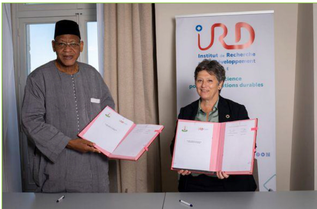
10 Mai 2023 à Marseille signature d'un accord cadre de partenariat entre l'IRD et l'ANSAL-BF