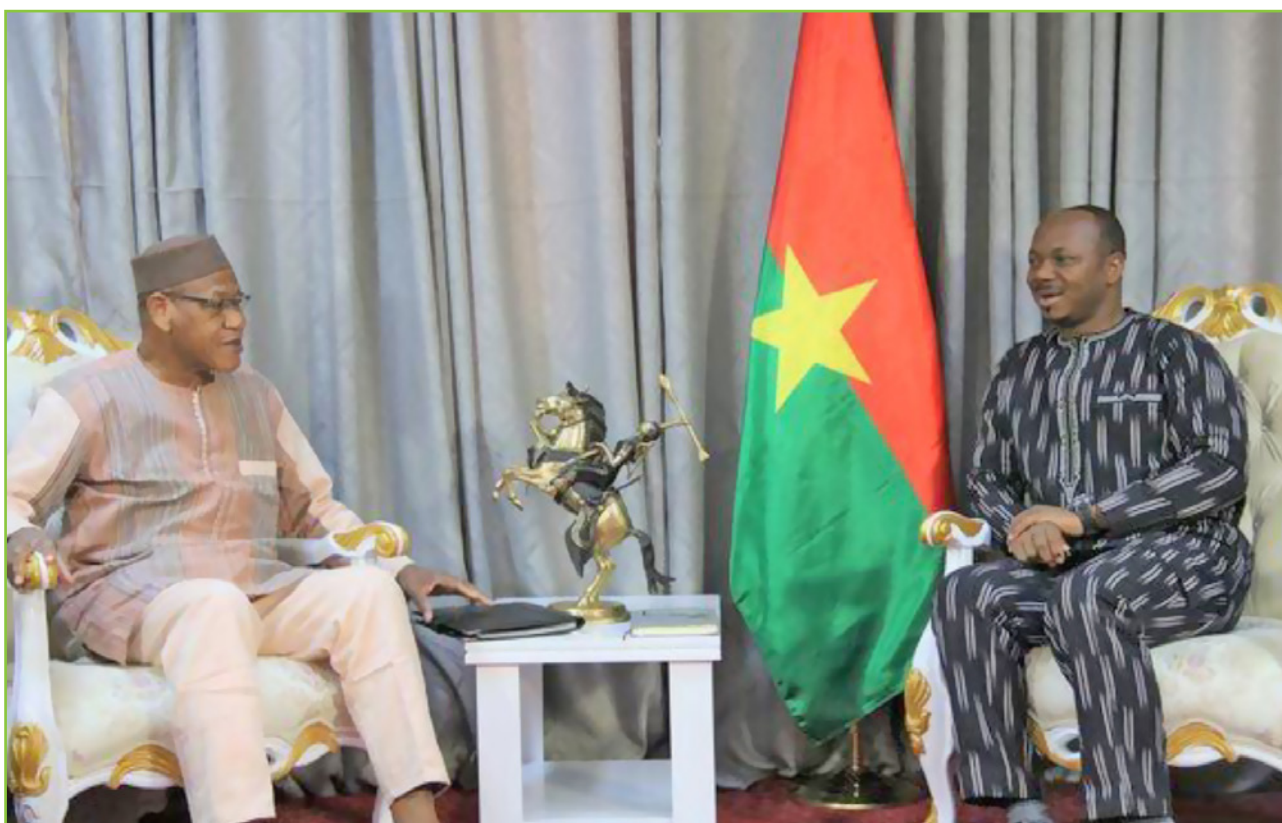
Le Président de l'ANSAL-BF à (gauche) et celui de l'ALT à (droite) en tête à tête