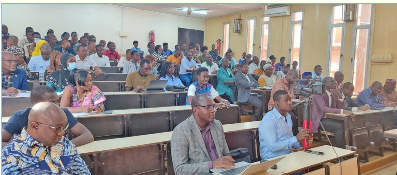
Les participants à la conférence sur l'importance du capital dans les sociétés commerciales en droit OHADA