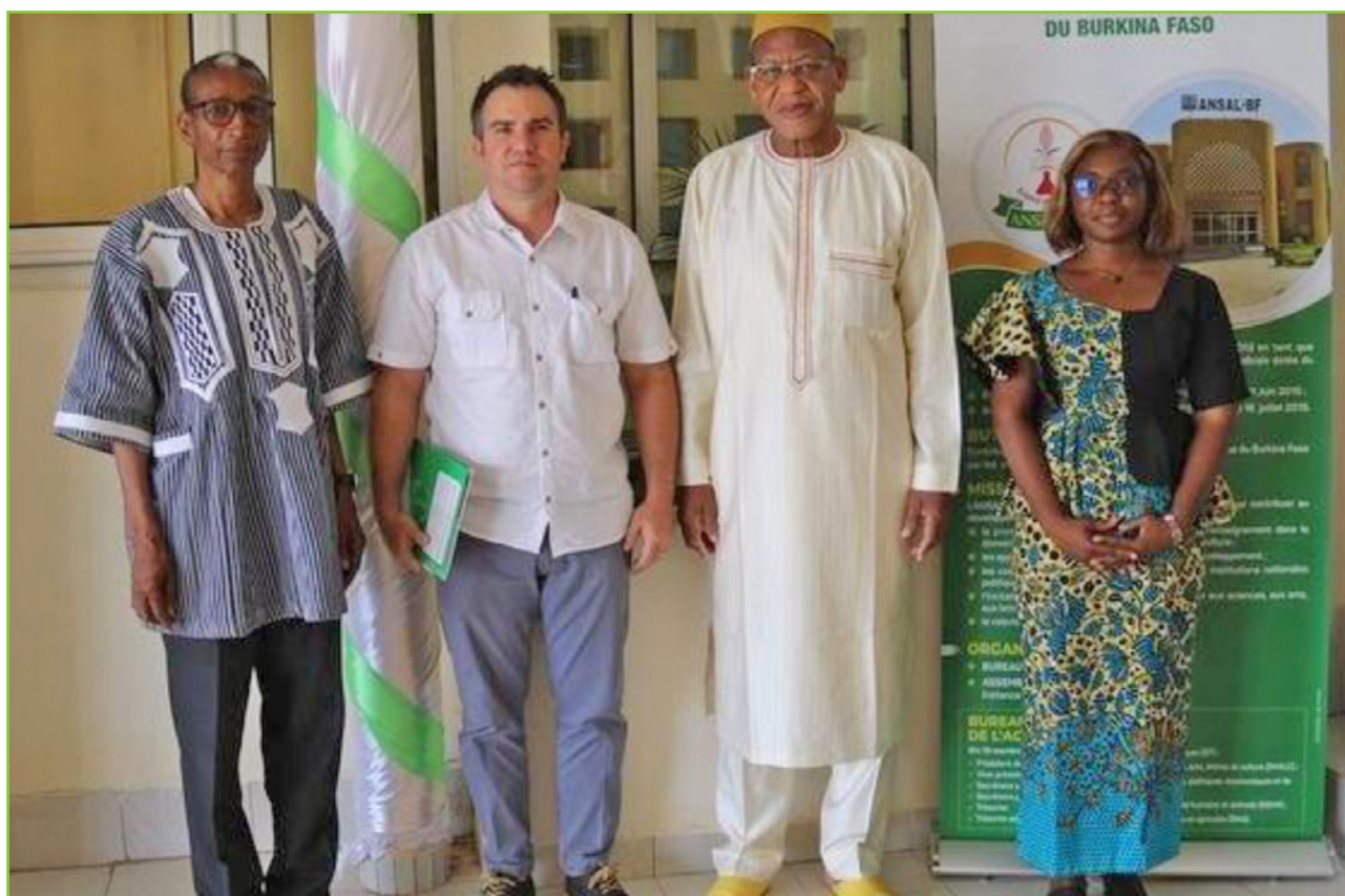
L'audience du 14 mars 2023 avec le représentant de l'IRD à l'ANSAL-BF

Enfin, le 13 octobre 2023, le Représentant de l'IRD au Burkina Faso a rendu une visite de courtoisie au Président de l'ANSAL-BF. A cette occasion un point des activités qui lient les deux institutions a été fait ainsi que des événements auxquels l'Académie est conviée. Il a saisi l'occasion pour remettre au Président de l'Académie un livre sur le foncier rural.