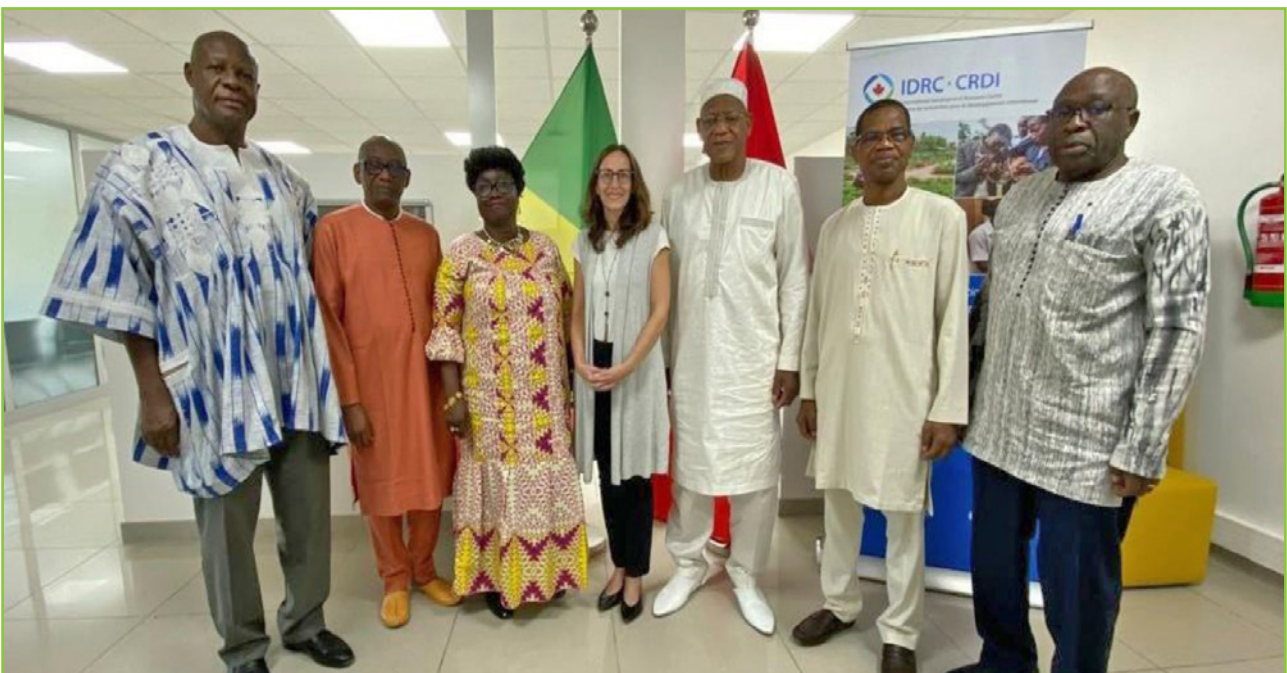
La délégation de l'ANSAL-BF à l'IDRC- CRDI