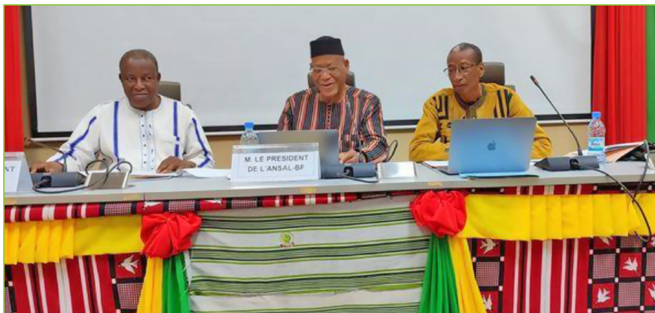
Le présidium de l'Assemblée générale ordinaire du 14 décembre 2023