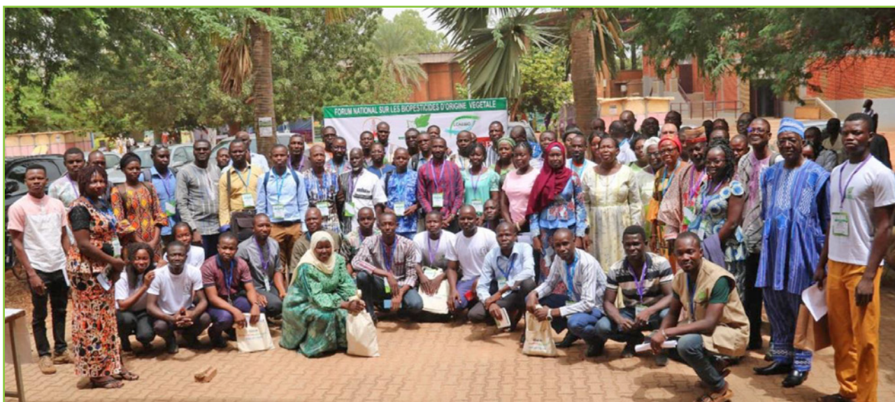
La photo de famille des participants au forum multi-acteurs sur les formulations biopesticides à base de plantes