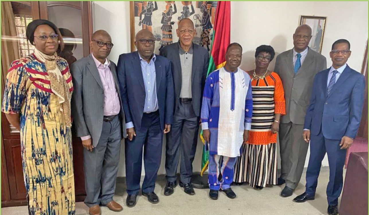
La délégation de l'ANSAL-BF à l'ambassade du Burkina au Sénégal

La mission a été mise à profit pour, d'une part discuter avec le Bureau et les membres de l'ANSTS, et d'autre part rencontrer un certain nombre de partenaires potentiels : l'Ambassadeur du Burkina Faso au Sénégal, la Directrice régionale Afrique de l'Ouest de l'Agence universitaire de la Francophonie (BRAO-AUF), le CORAF, l'African Union Development Agency (AUDA) et le Centre de Recherches pour le Développement International (CRDI).