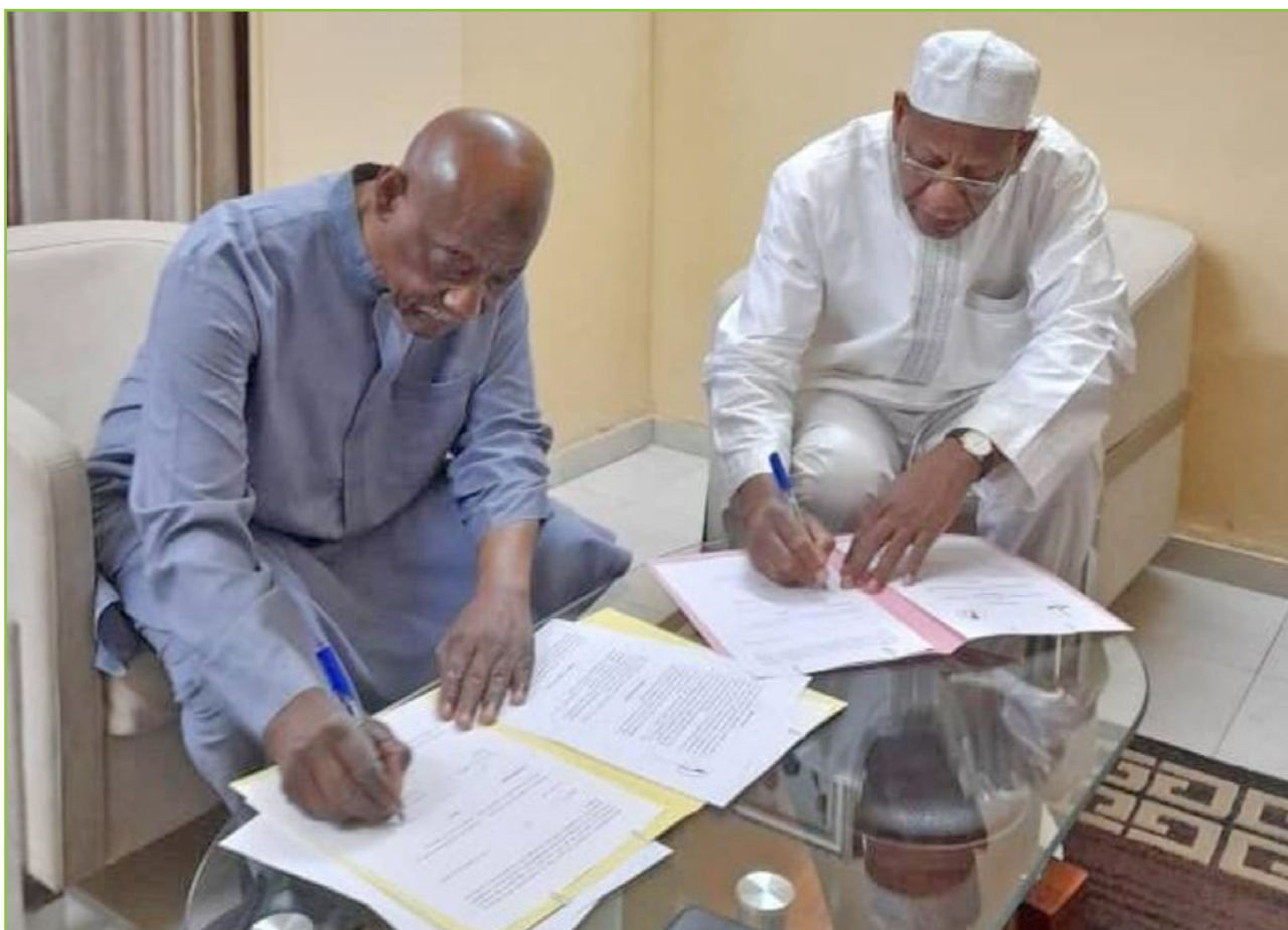
La signature d'un Protocole d'Accord entre l'ANSAL-BF et l'ANSTS

Une des décisions importantes de la mission a été la signature d'un Protocole d'Accord entre l'ANSAL-BF et l'ANSTS.