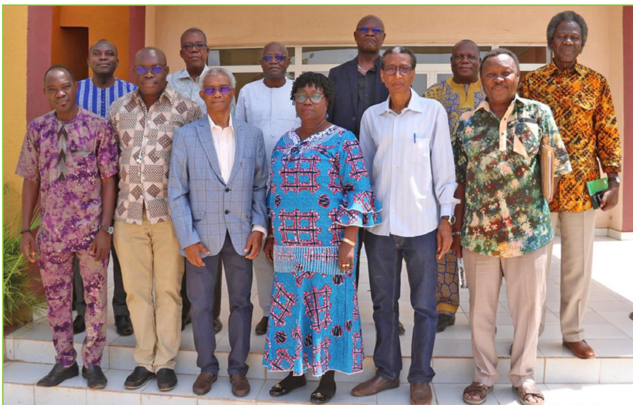
La photo de famille des participants à la restitution des résultats de l'étude sur les mines d'or et insécurité