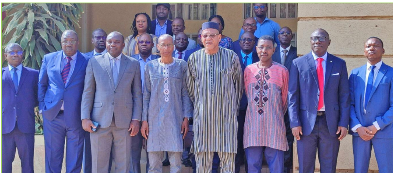
La photo des officiels à la journée d'études sur les mutations des entreprises publiques au Burkina Faso