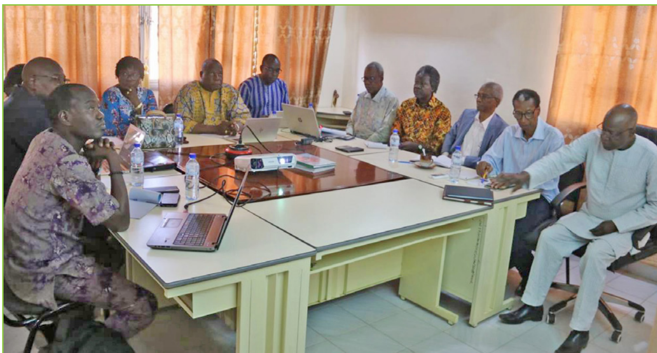
Les participants à la restitution des résultats de l'étude sur les mines d'or et insécurité