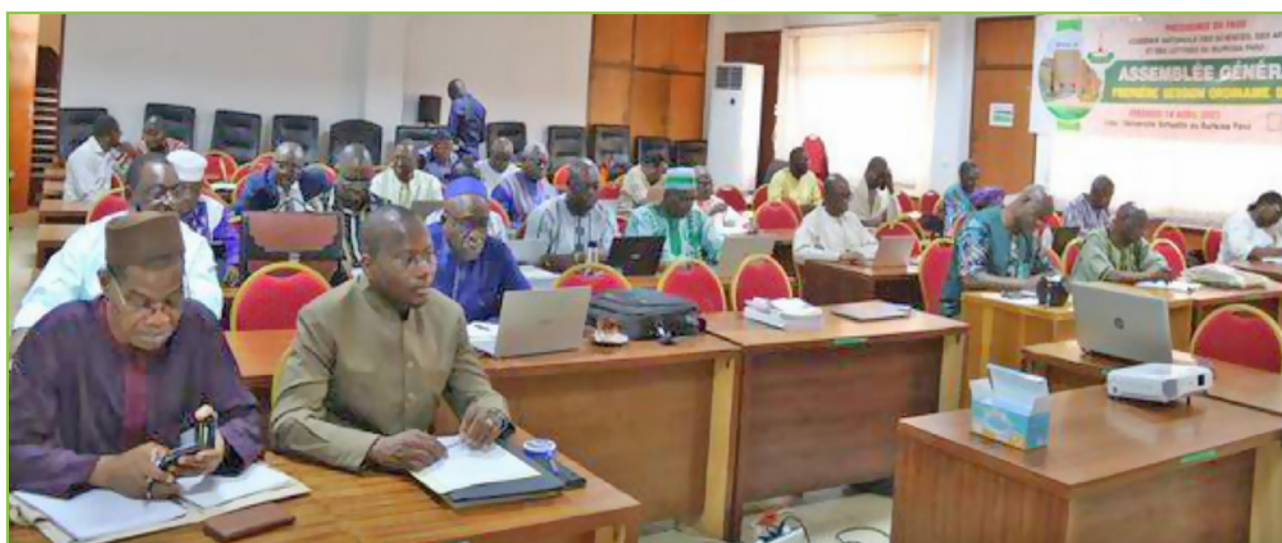
Les participants à l'Assemblée générale ordinaire du 14 avril 2023