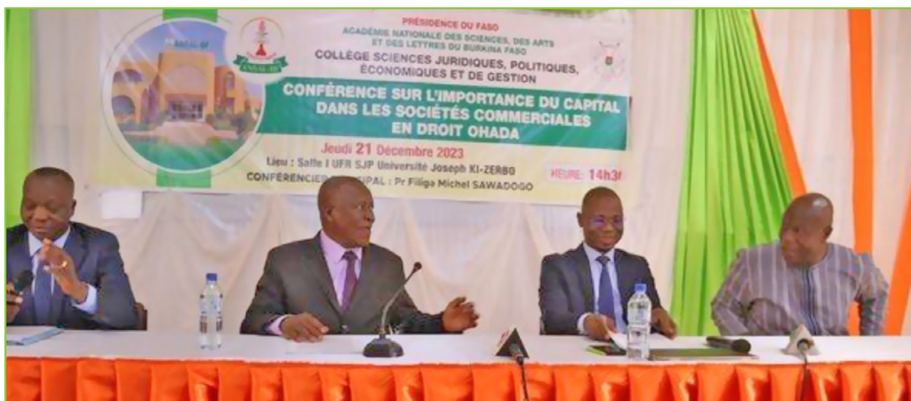
Le présidium de la conférence sur l'importance du capital dans les sociétés commerciales en droit OHADA