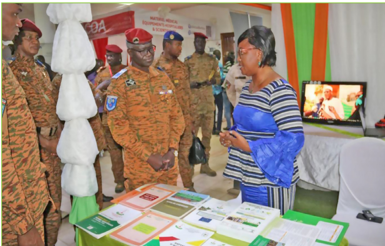
Le Ministre en charge de la défense le Général de Brigade Kassoum COULIBALY s'entretenant avec la chargée de communication de l'ANSAL-BF.