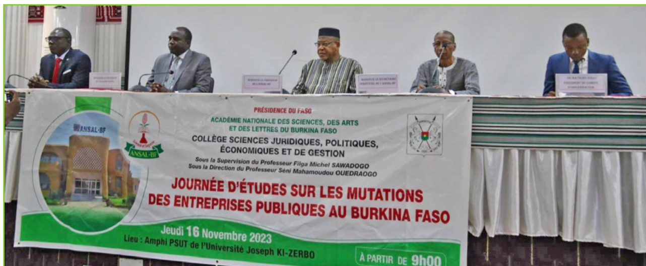
Le Présidium de la journée d'études sur les mutations des entreprises publiques au Burkina Faso