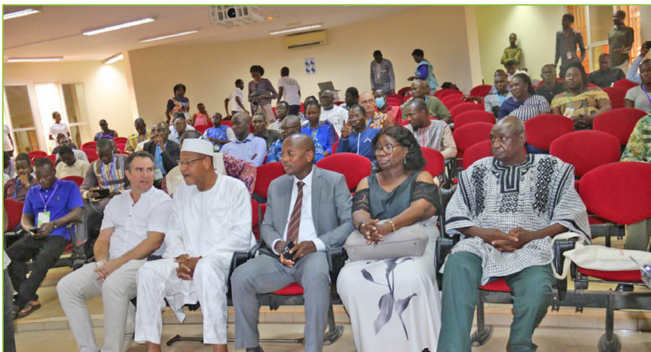
Les participants à la clôture du forum multi-acteurs sur les formulations biopesticides à base de plantes