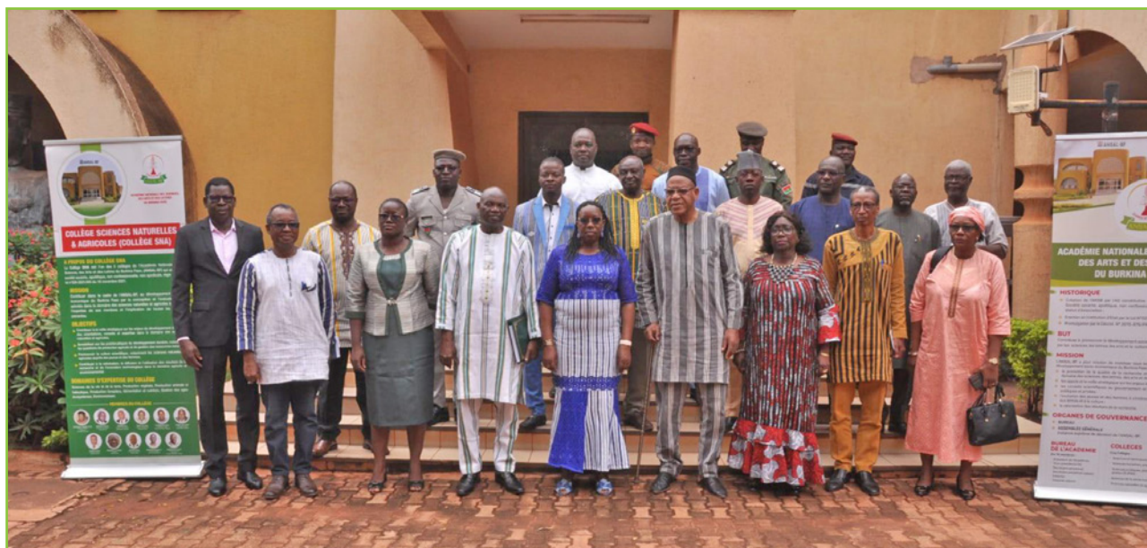
La photo des officiels à la Conférence sur la distribution et l'utilisation des pesticides au Burkina Faso

Dans le cadre des concertations permanentes au sein du Collège, cinq réunions ordinaires et quatre réunions extraordinaires ont été tenues au cours de l'année.