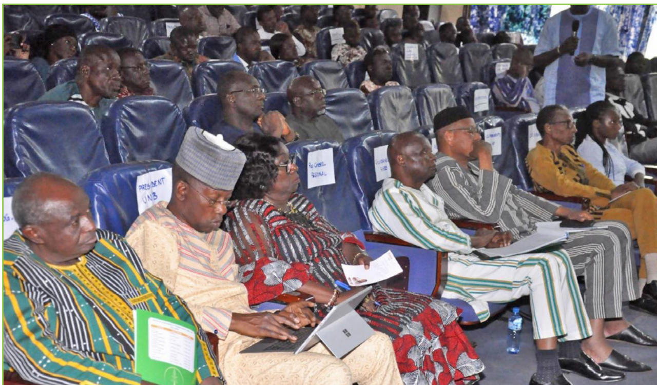
Les participants à la Conférence sur la distribution et l'utilisation des pesticides au Burkina Faso

A l'issue de la conférence, des recommandations ont été formulées à l'endroit du gouvernement du Burkina Faso et des organisations régionales (UEMOA, CEDEAO, CILSS). Leur mise en œuvre permettra de faire progresser les Etats de l'espace régional vers une utilisation plus responsable des pesticides, ce qui contribuera à la préservation de la biodiversité, à la sécurité alimentaire et à la santé globale des populations. Par ailleurs il a été recommandé à l'ANSAL-BF de mener des réflexions sur la faible efficacité de l'application des bonnes pratiques en dépit de la réglementation existante et de poursuivre la sensibilisation et la capitalisation des bonnes pratiques en organisant une conférence sur les pesticides au niveau régional. Le dynamisme de ce Collège lui a permis de mobiliser les ressources complémentaires nécessaires à la tenue de cette conférence grâce à l'apport financier de ses partenaires nationaux et internationaux. Des perspectives heureuses s'ouvrent d'ores et déjà à l'échelle sous-régionale pour la tenue d'une conférence similaire.