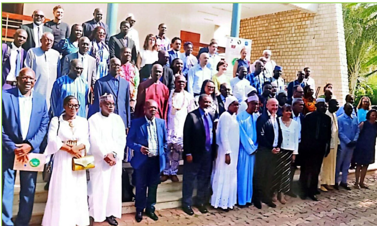
Les participants aux « Assises internationales des Médecines traditionnelles- Savoirs et pratiques traditionnels face aux défis actuels de la santé, de la recherche, du développement et des sciences de la durabilité »