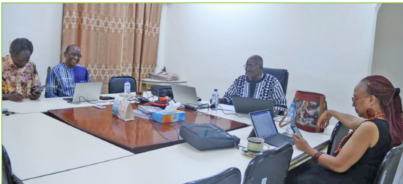
Rencontre en présentiel et en visio-conférence de la commission (CRP)