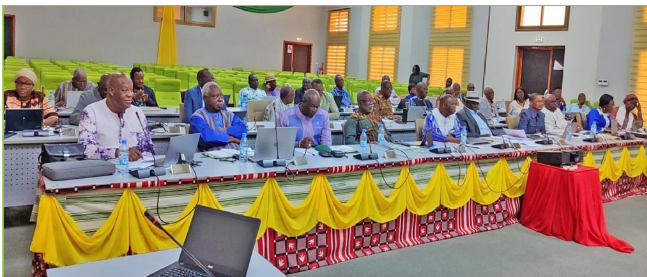
Les participants à l'Assemblée générale ordinaire du 14 décembre 2023