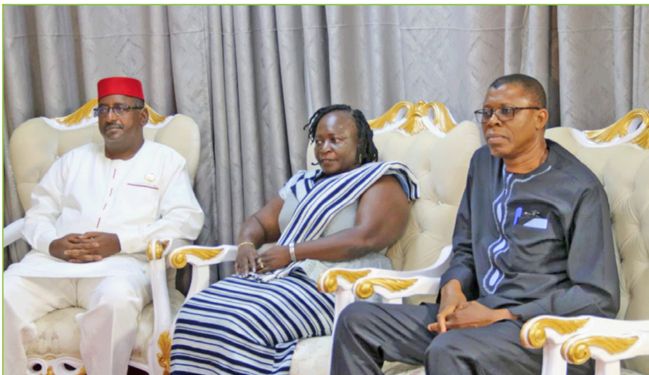
La délégation du président de l'ALT participant à l'audience