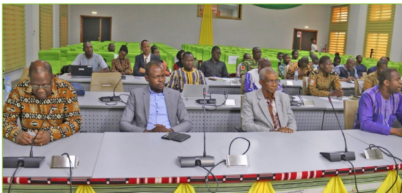
Participants à la conférence sur l'ampleur de la drogue au Burkina Faso dans un contexte de crise