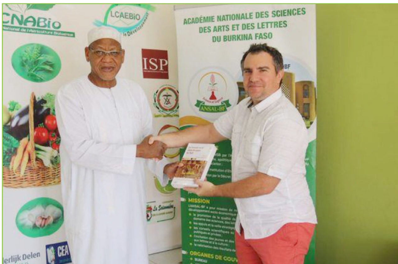
L'audience du 13 octobre avec le Représentant de l'IRD